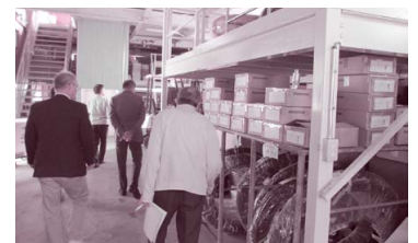
● 倉庫 風景