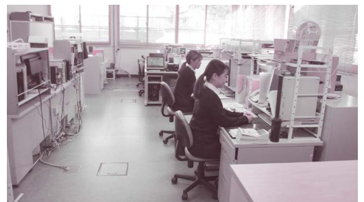
● 事務所 風景