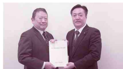
出田会長(左)より神津衆議院議員(右)へ

住民税の超過課税は、個人ではなく主に法人を課税対象としているうえ、長期間にわたって課税を実施している自治体が多い。課税の公平を欠く安易な課税は行うべきでない。