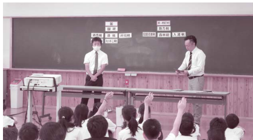
千曲市立東小学校 9月11日

青年部員が講師を務めている社会貢献事業の小学校における「租税教室」を、6月末から16小学校17教室実施しました。9月11日から10月8日までの4小学校のようすを写真にてお知らせします。