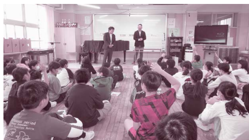
上田市立清明小学校 10月8日