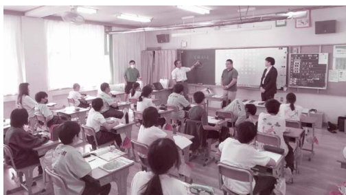
千曲市立上山田小学校 10月2日