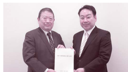
出田会長(左)より羽田参議院議員(右)へ