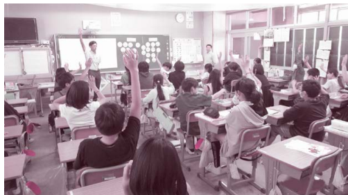
青木村立青木小学校 9月20日