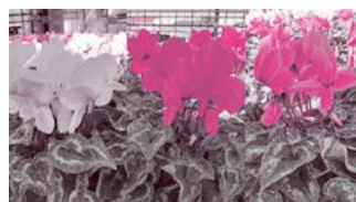
パステル・グランシリーズ

代表的なシクラメンの品種の「パステル」の中でも二回りほど大きな花を咲かせるグランシリーズです。一輪一輪に存在感があり、パステル特有の鮮やかでクリアな花色も相まって、ひときわ室内を明るい雰囲気してくれます。