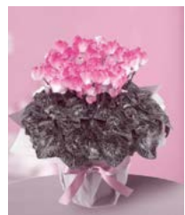
プリンセスマリアージュ

多くのシクラメンは種子から生産されますが、写真のようなピンクの濃淡が美しく現れる花が出る確率が1/2程度という、生産者泣かせの気まぐれな品種がこの「プリンセスマリアージュ」。花色、花形に多少の個体差が出ますが、美しいグラデーションの花色は、寒くなる季節に、ほっと心を温めてくれることでしょう。