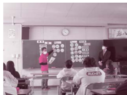
東御市立田中小学校 12月7日