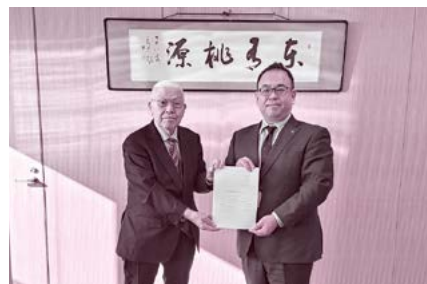
小平戸倉上山田支部長(左)より千曲市小川市長(右)へ