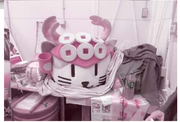
●ゆきたんのぬいぐるみ