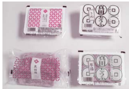
●おとうふ、厚揚げ、油揚げ