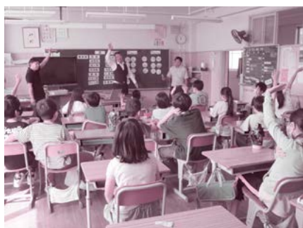
上田市立清明小学校 9月27日

青年部員が講師を務める社会貢献事業の小学校における「租税教室」を、今年度は7月から実施しています。12月7日現在、12小学校18教室を実施しました。9月27日から12月7日まで実施しました3小学校のようすを写真にてお知らせします。さらに3小学校4教室が予定されております。