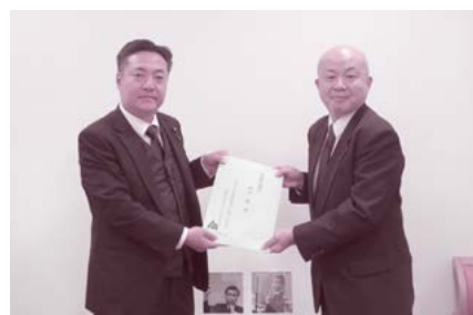
和田税制委員長(右)より神津衆議院議員(左)へ

住民税の超過課税は、個人ではなく主に法人を課税対象としているうえ、長期間にわたって課税を実施している自治体も多い。課税の公平を欠く安易な課税は行うべきでない。