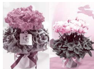
左・天空/右・月うさぎ

今年は皆既月食と天王星食が同時に起こる442年ぶりの天体ショーの感動が記憶に新しいですが、シクラメン「月のうさぎは」、月明りを思わせる幻想的な花色が特徴。「天空」と同じく「大栄花園」