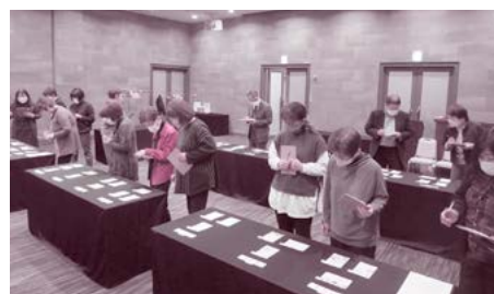
(詳しいご報告は4月号にて)

11月22日 国税局長記念講演会 出田会長・金井事務局長 出席 ホクト文化ホール 11月27日 税に関する絵はがきコンクール 表彰作品選考会 上田高砂殿