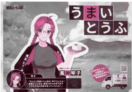
●公式キャラクター 風神 琴子