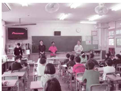
東御市立北御牧小学校 10月10日