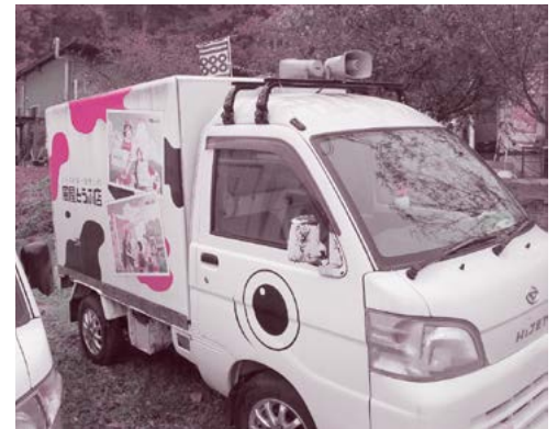
●キャラクターをデザインした移動販売車