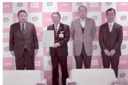
出田会長(左)より上田市土屋市長(左から2番目)へ